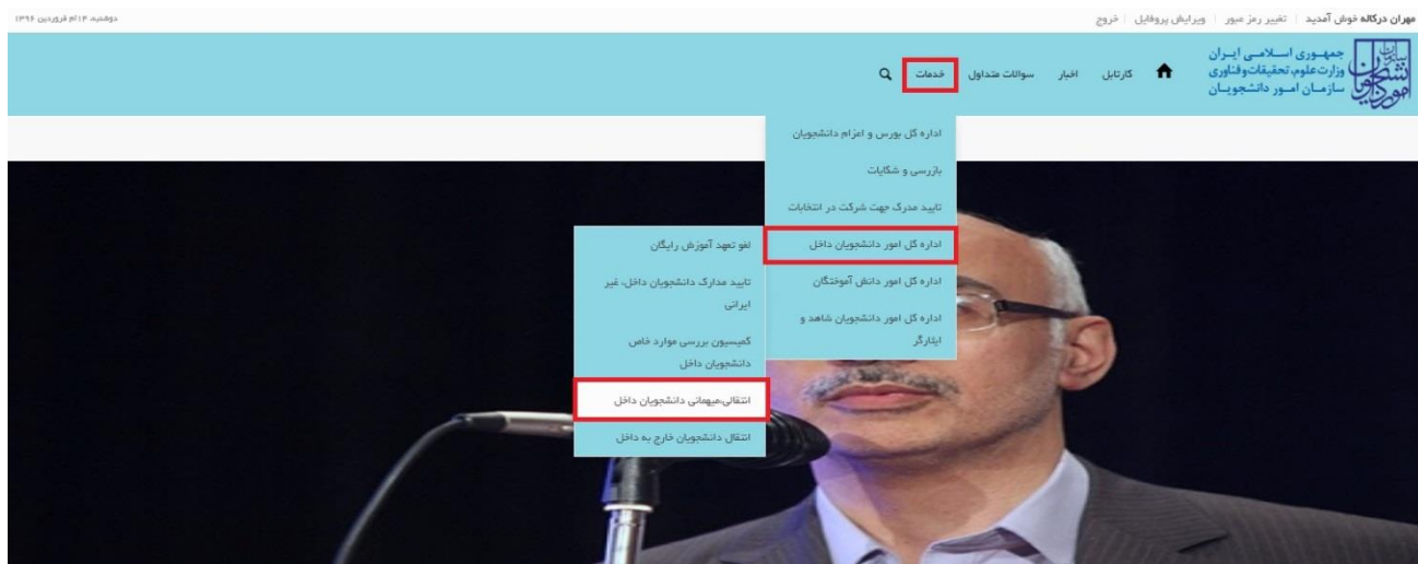
تصویر ۱-نمایش پورتال

توجه بفرمایید که متقاضی برای مشاهده این درخواست در منوی خدمات، باید حداقل یک مقطع تحصیلی کاردانی یا کارشناسی داخل کشور با وضعیت تحصیلی شاغل به تحصیل یا مرخصی تحصیلی (نوع دانشگاه غیر از پیام نور و جامع علمی کاربردی) یا یک مقطع تحصیلی داخل کشور دکتری حرفه ای در رشته دامپزشکی با وضعیت تحصیلی شاغل به تحصیل یا مرخصی تحصیلی در پروفایل ثبت نام خود داشته باشد. در صورت عدم مشاهده این درخواست، پروفایل خود را از طریق گزینه ویرایش پروفایل، اصلاح نمایید و سپس از منوی خدمات به ثبت درخواست مربوطه بپردازید.