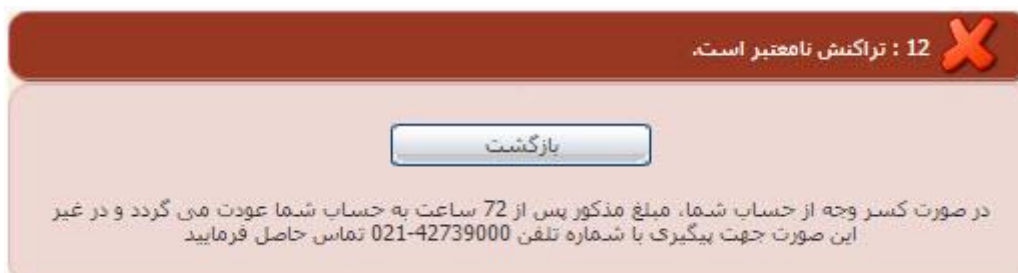
تصویر ۸-نمایش اخطار تراکنش ناموفق

با دریافت پیغام جهت مراجعه به پورتال، برای مشاهده وضعیت خود اقدام نمایید. از طریق پورتال سازمان امور دانشجویان سربرگ کارتابل را انتخاب نمایید.(تصویر 9)