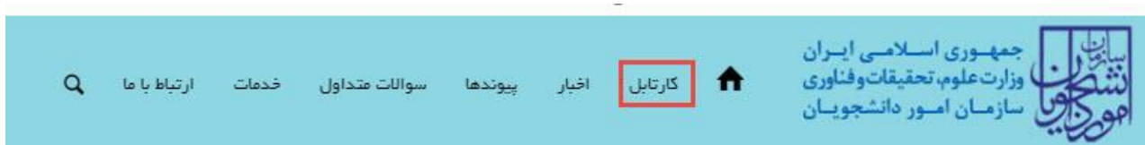
تصویر ۹-کارتابل شخصی

با دریافت پیغام جهت مراجعه به پورتال، برای مشاهده وضعیت خود اقدام نمایید. از طریق پورتال سازمان امور دانشجویان سربرگ کارتابل را انتخاب نمایید.(تصویر 9)